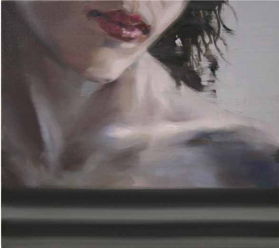
In Safe Öl auf Leinwand, 40 x 45 cm, 2015 EUR 3 200.-