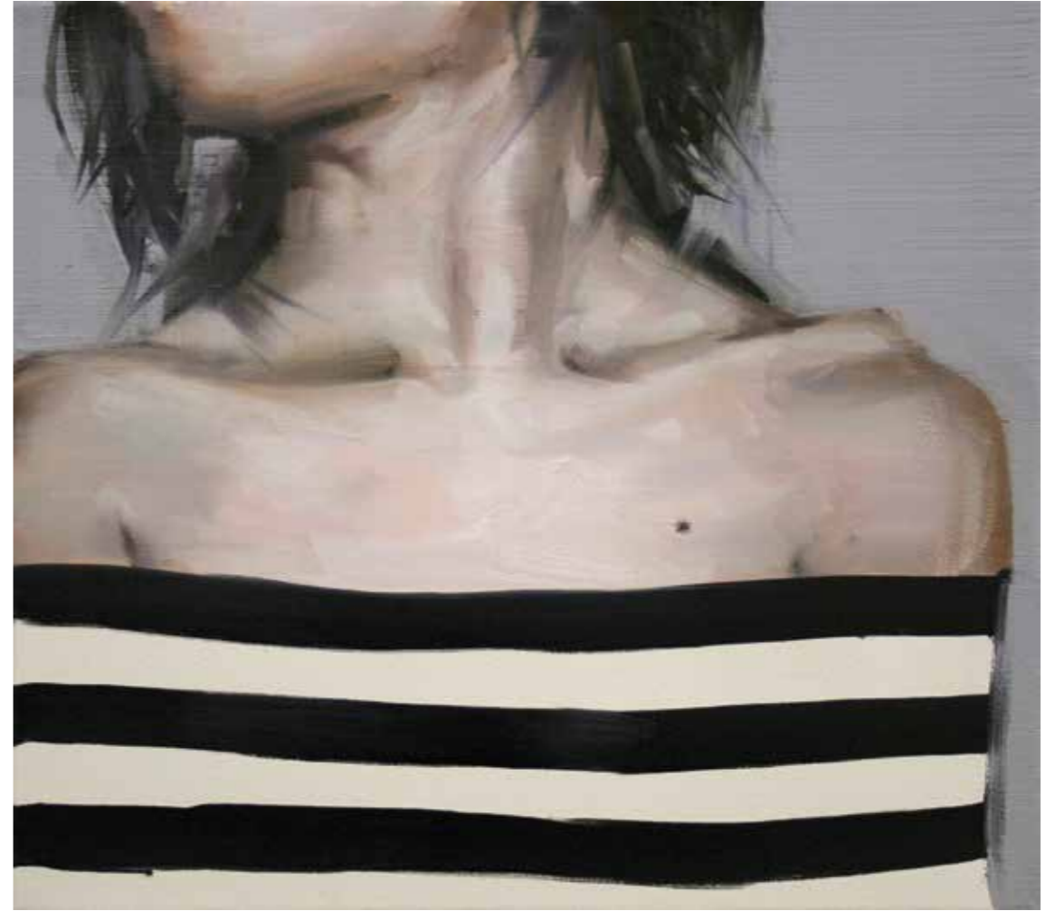
In Safe Öl auf Leinwand, 40 x 45 cm, 2015 EUR 3 200.-