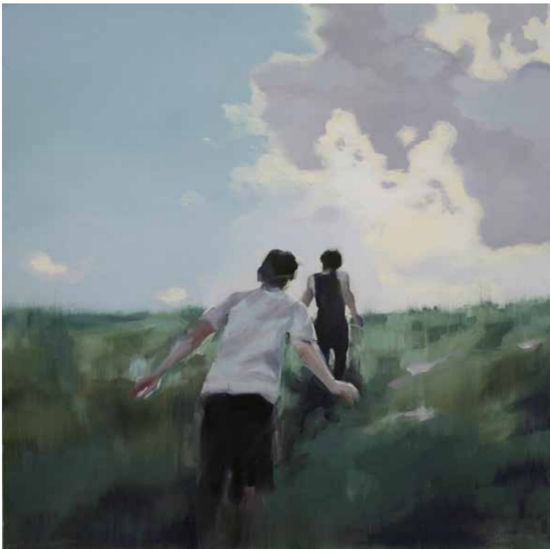
Brothers Öl auf Leinwand, 73 x 70 cm, 2015 EUR 4 600.-