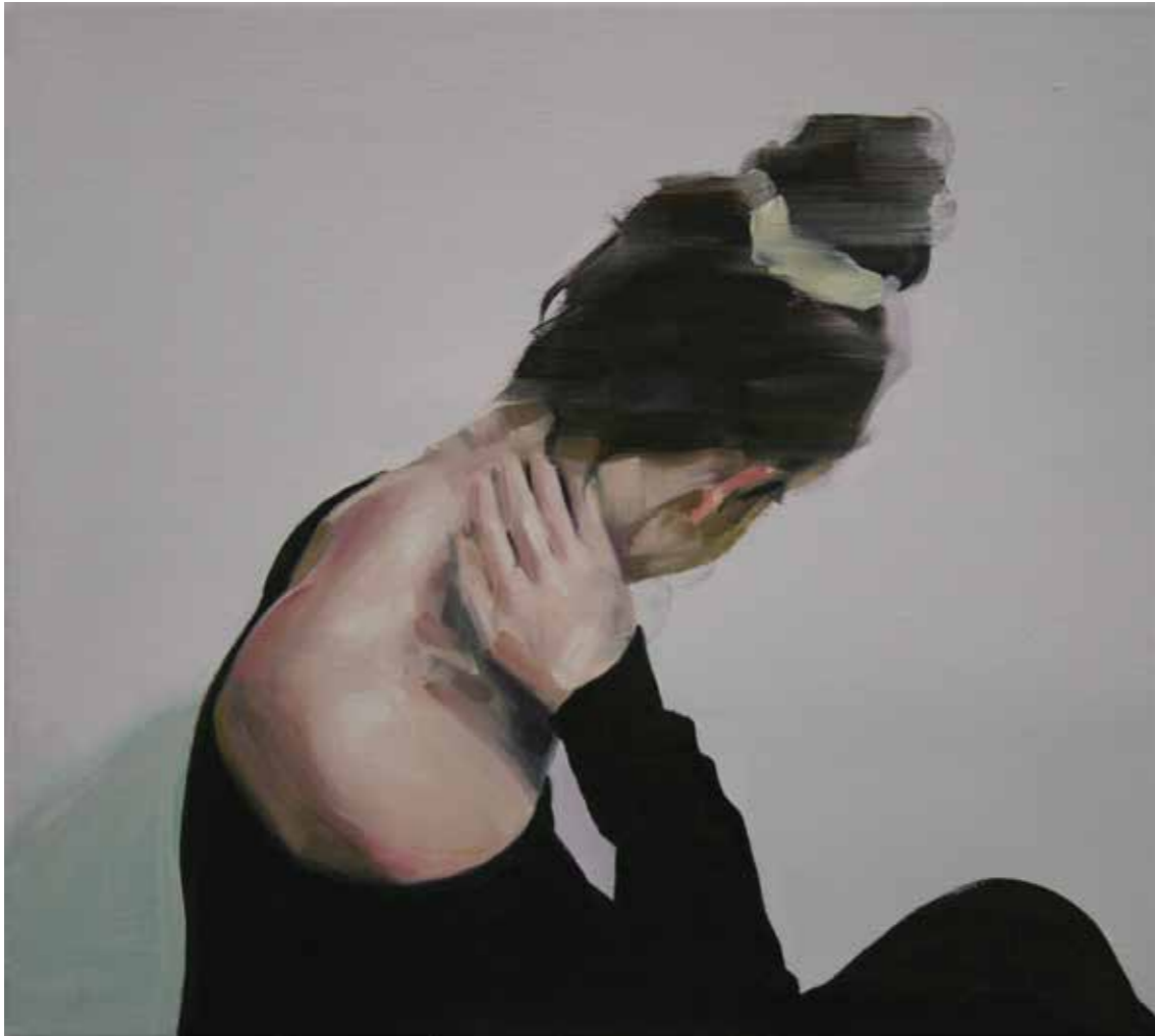
In Safe Öl auf Leinwand, 45 x 50 cm, 2015 EUR 3 800.-