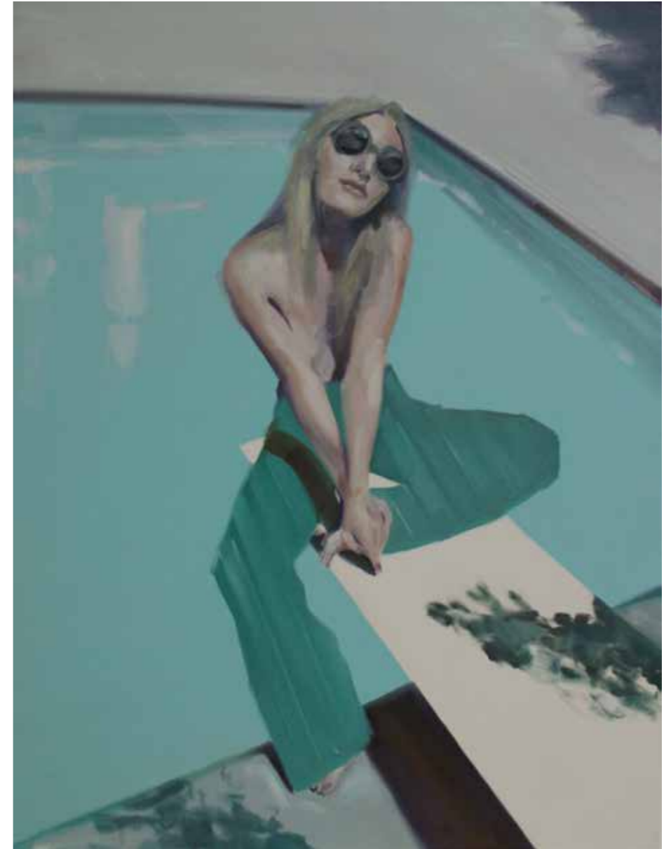
The Pool Öl auf Leinwand, 70 x 73 cm, 2015 EUR 4 600.-