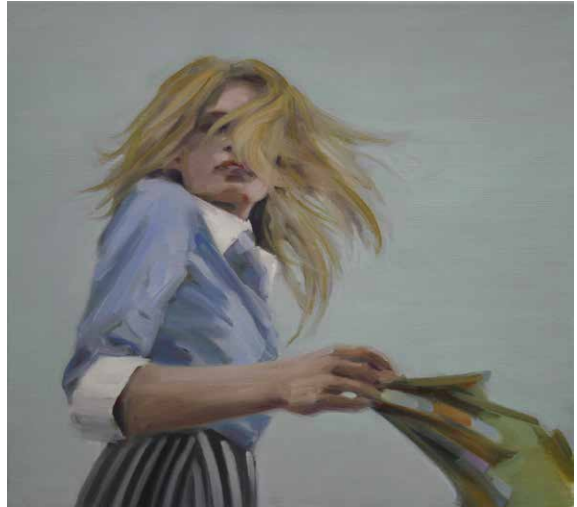
In Safe Öl auf Leinwand, 40 x 45 cm, 2015 EUR 3 200.-