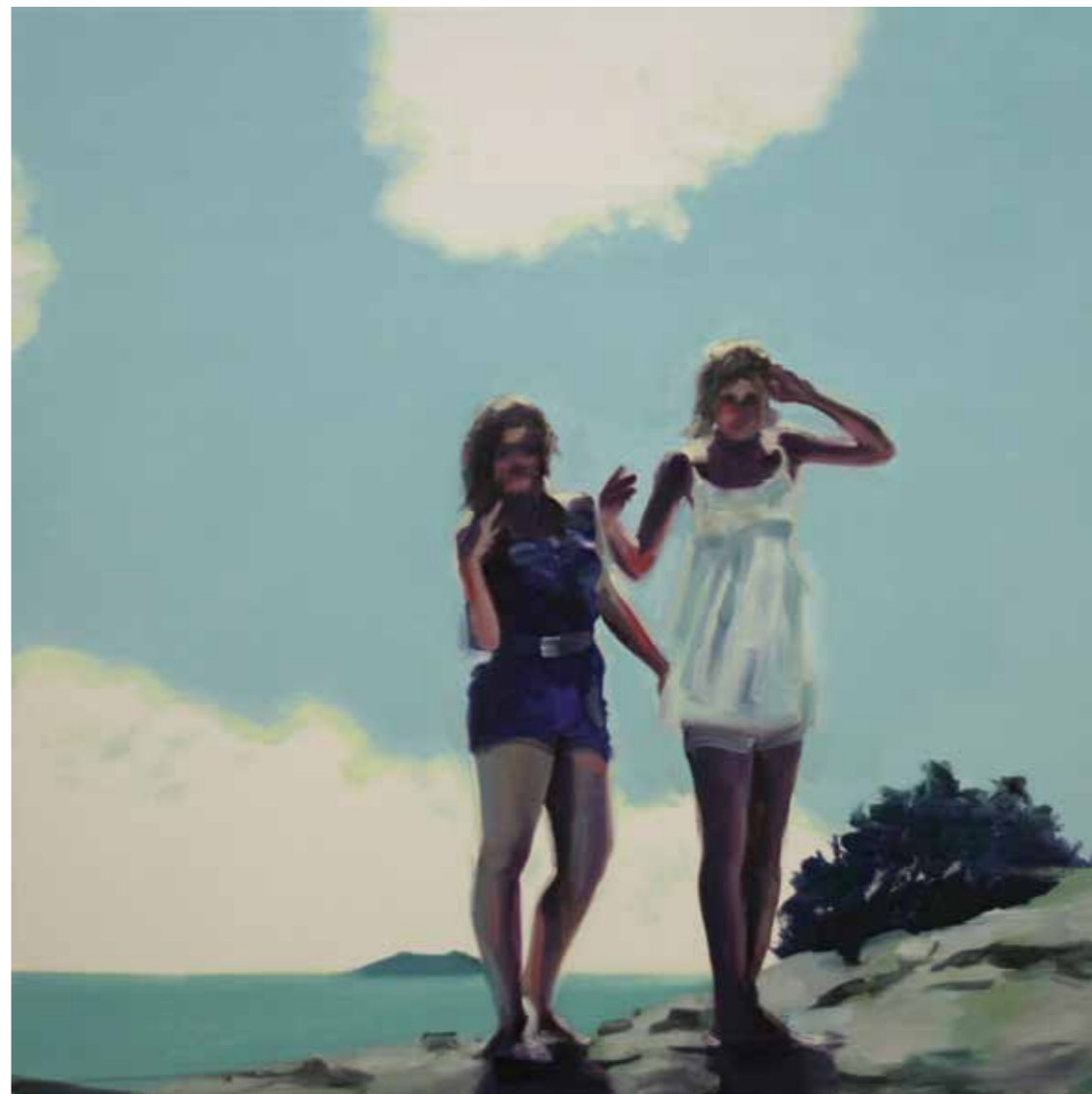
Sisters Öl auf Leinwand, 73 x 70 cm, 2015 EUR 4 600.-