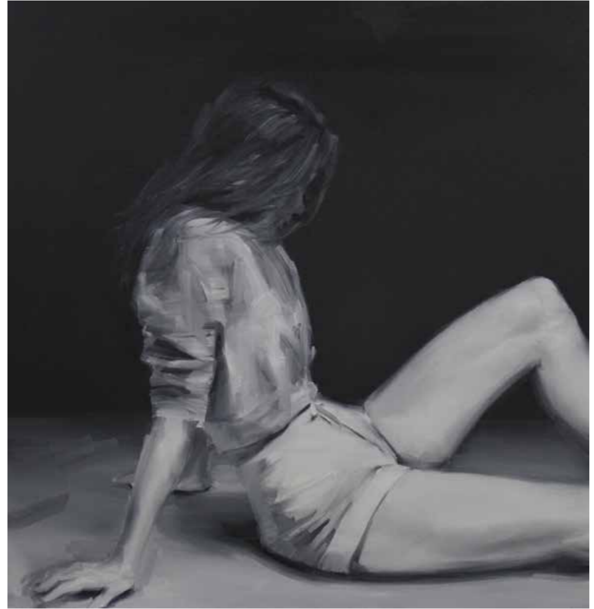
Clean Table Öl auf Leinwand, 32 x 40 cm, 2015 EUR 2 600.-