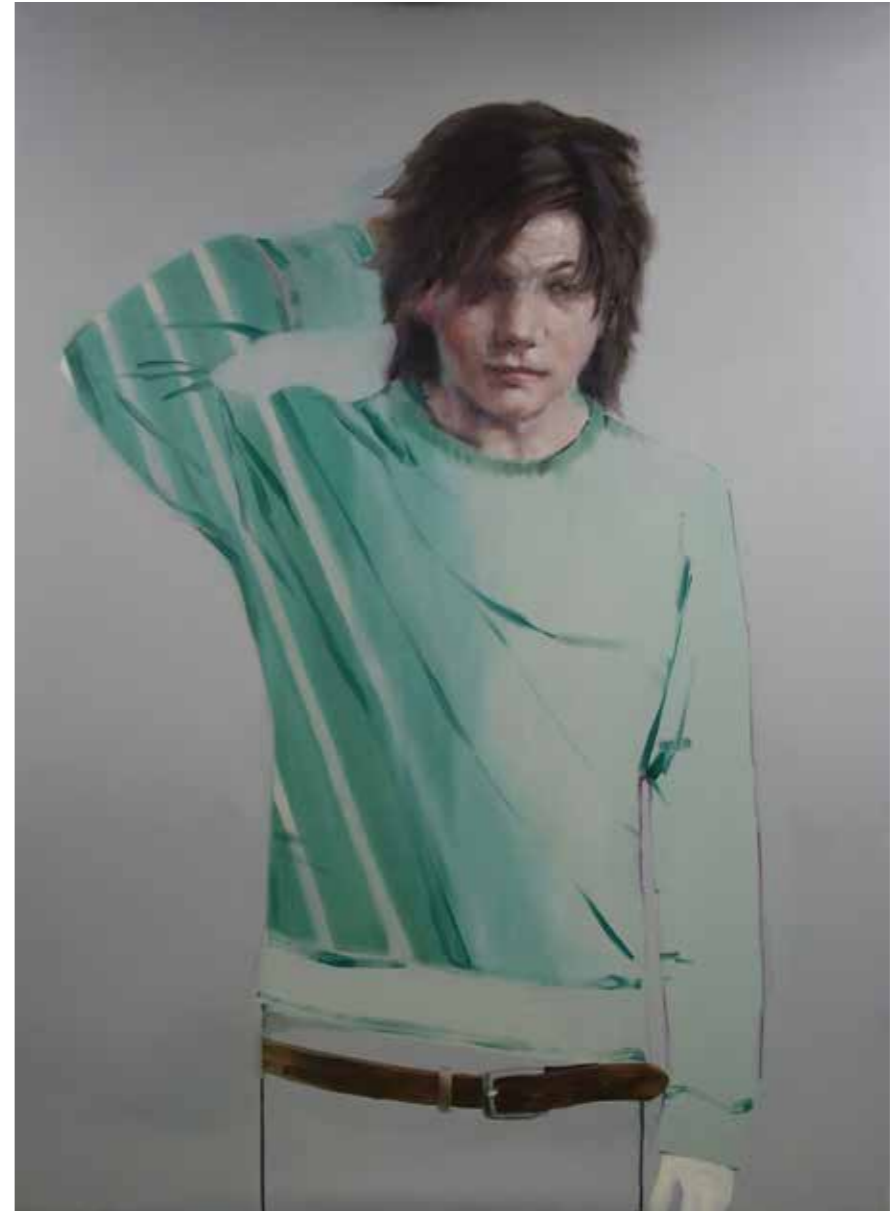
The Beach Öl auf Leinwand, 250 x 165 cm, 2015 EUR 15 000.-