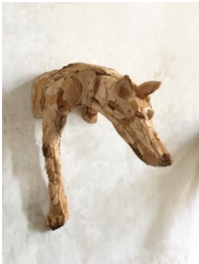
Entry IV, 2016 90 x 48 x 64 cm, wood