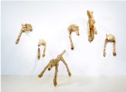
Entry I, 2016, 77 x 46 x 61 cm, wood

Ausstellung vom 16.02.2017 bis 30.03.2017