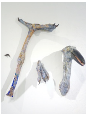
Museum Bird, 2015 110 x 98 x 69 cm painted wood