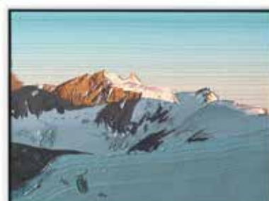
Ohne Titel 15 × 20 cm, Öl/MDF, Schattenfugenrahmen 2021, je 980 EUR