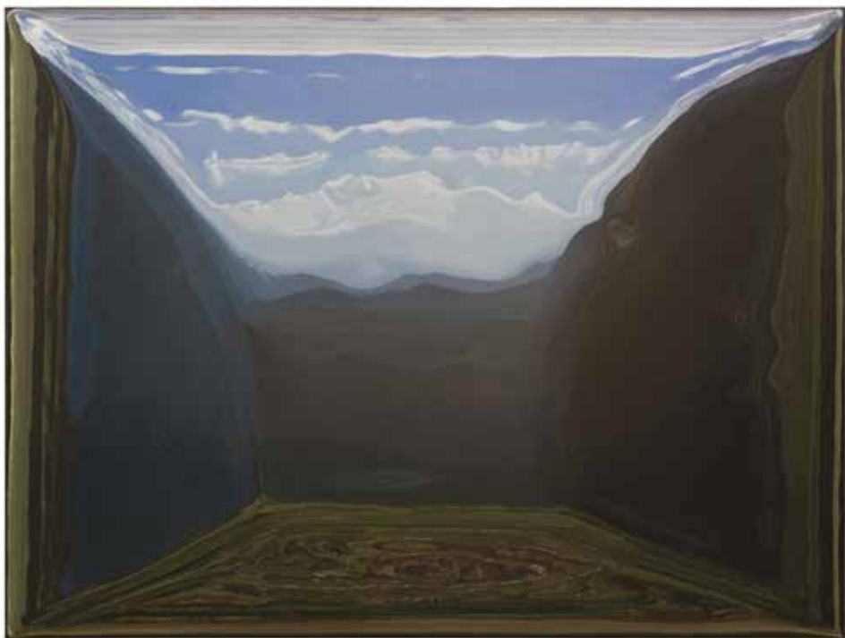
12 Rotwand1 150 × 200 cm Öl/Leinwand 2017, 11.600 EUR