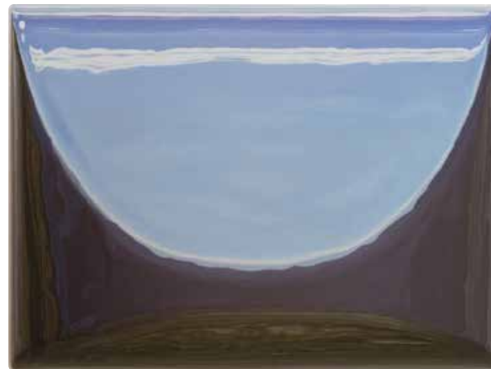
Rotwand3 37,5 × 50 × 6 cm Ölfarbe/MDF-Relief 2017, 2.900 EUR