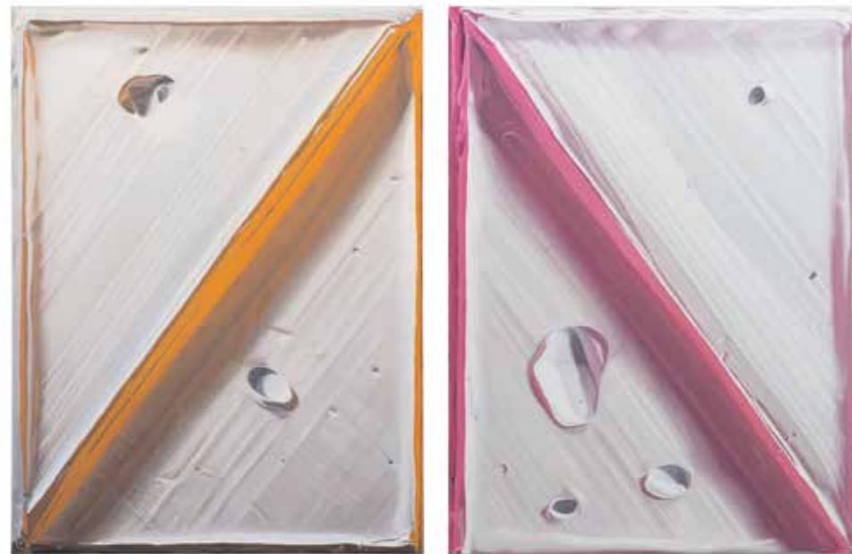
Zweiteilig, bestehend aus: weiß, orange vr weiß, pink vl Gesamtpreis 120 × 90 cm Öl/Leinwand 2021, 13.800 EUR