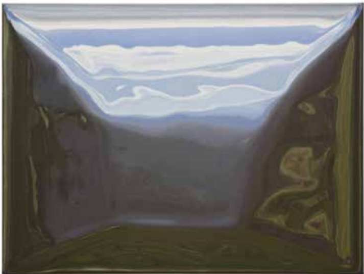
14 Rotwand 60 × 80 cm Öl/Leinwand 2018, 4.600 EUR