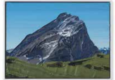
Ohne Titel 15 × 20 cm, Öl/MDF, Schattenfugenrahmen 2021, je 980 EUR