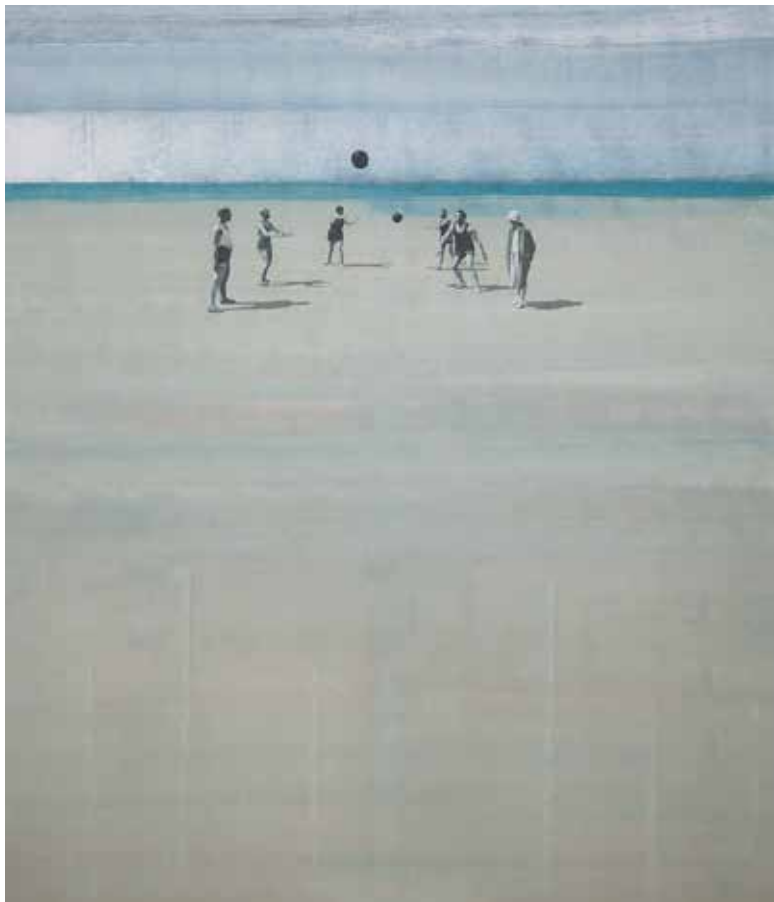
High society 140 x 120 cm, Acryl auf Leinwand, 2015 EUR 8.200.-