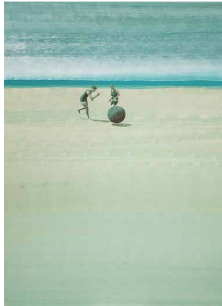
Fair Play 150 x 110 cm, Acryl auf Leinwand, 2015, EUR 7.800.-