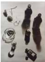
Stillleben 110 x 80 cm, Öl auf Leinwand, 2018