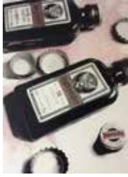
Jägermeister 110 x 80 cm, Öl auf Leinwand, 2018