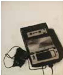
Kassettenrekorder 30 x 25 cm, Öl auf Leinwand, 2014