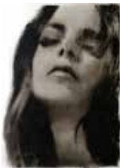
Girl 110 x 80 cm, Öl auf Leinwand, 2018