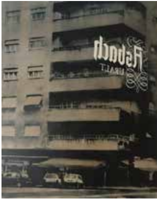
Asbach 170 x 130 cm, Öl auf Leinwand, 2015

In Zeiten digitaler Allgegenwärtigkeit bildet Süssmayr das Unverfälschte ab, das Ungestellte und schafft damit eine malerischen Gegenwelt zur omnipräsenten Inszenierung des eigenen Selbst im fotografischen Beweismaterial, einen gemalten Gegenpol zum gestellten Blickwinkel auf die Welt. Das scheinbar Banale, das Unspektakuläre, der Moment: vielleicht ist es eben nun Aufgabe der Malerei, Wirkliches zum Bildgegenstand zu erheben, wo das Künstliche ein jeder selbst zu produzieren vermag – täglich. Ekstase kann nicht aus Künstlichkeit erwachsen, Hingabe bedingt Echtheit: Florian Süssmayr hat also den passenden Modus gefunden, diese nicht nur zu verbildlichen, sondern auch zu zelebrieren. Am Ende einer solchen Nacht, die mit dem Erblicken verheissungsvoller Straßenzüge beginnt, sich fortsetzt im Wirtshaus, bei einem Fußballspiel, einem Konzert, einer Festivität, in einer Bar oder im Tanz, hat man sich gefunden und wieder verloren, vielleicht – in jedem Fall ist man herausgetreten aus seinem eigentlichen Leben und tritt bestenfalls verändert wieder ein.