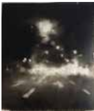
Sonnenstraße 115 x 100 cm, Öl auf Leinwand, 2017