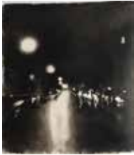
Schillerstraße 115 x 100 cm, Öl auf Leinwand, 2017