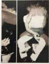
Disko 200 x 150 cm, Öl auf Leinwand, 2017