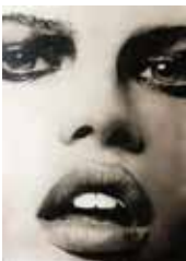
Girl 110 x 80 cm, Öl auf Leinwand, 2018