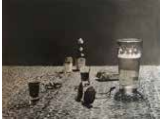
Stilleben 90 x 120 cm, Öl auf Leinwand, 2018