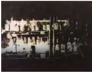
Bar 95 x 120 cm, Öl auf Leinwand, 2002