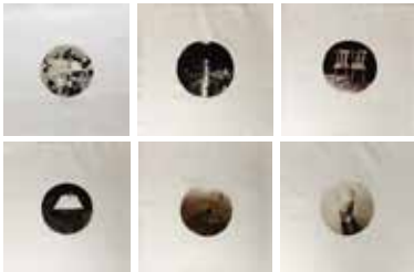
Still alive 55 x 55 cm, Öl auf Leinwand, 2018