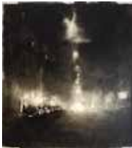
Landwehrstraße 115 x 100 cm, Öl auf Leinwand, 2017