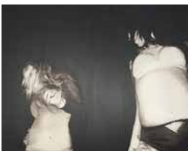
Disko 130 x 160 cm, Öl auf Leinwand, 2014