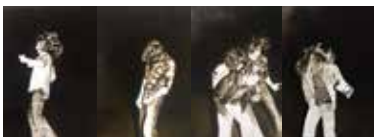
Headbanger je 70 x 50 cm, Öl auf Leinwand, 2018