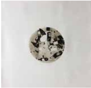
Sonnenstraße 55 x 55 cm, Öl auf Leinwand, 2018