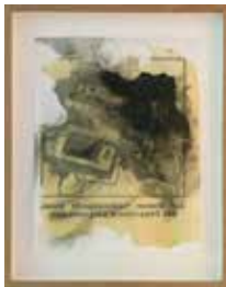
Auf diesem Tonbandgerät ... 30 x 25 cm, 2014