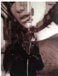
Selbstporträt Barerstraße 140 x 110 cm, Öl auf Leinwand, 2018