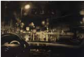
Final Taxi 110 x 160 cm, Öl auf Leinwand, 2014

E kstase! Das Ausrufungszeichen hinter diesem Nomen scheint überflüssig, birgt es doch bereits in seiner ursprünglichen Bedeutung eine Aufforderung: diejenige, aus sich selbst herauszutreten. Genau hierzu ruft das altgriechische „ekstasis“ auf, es dem Umsetzenden überlassend, woraus genau dieses Heraustreten zu bestehen habe. Das Selbst besteht in vielen Varianten: Ein jeder von uns trägt die Möglichkeit unzähliger Lebensformen in sich, vielfältige Interessen wie Begabungen, und doch kanalisieren sich diese mit der Zeit meist in einen einzigen Weg, biographischer Notwendigkeit oder dem Wunsch nach Saturiertheit geschuldet. Vorhersehbarkeit greift sich Raum, verdrängend, was noch da gewesen wäre an zu Lebendem, an Auszulebendem. Und so sucht der Mensch Orte auf, schafft sich Gegebenheiten, welche es möglich machen, herauszutreten aus dem Normativen in eine andere Normalität – für kurze Zeit: in die Normalität der Gaststätten, Bars, des Tanzes, der Konzerte, der Fussballspiele, der Festivitäten, des Rausches.