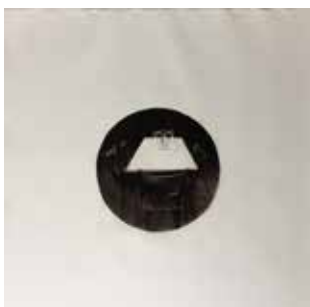
Lindwurmstüberl 55 x 55 cm, Öl auf Leinwand, 2018