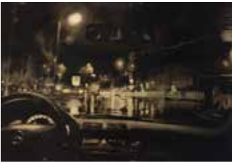
Final Taxi 110 x 160 cm, Öl auf Leinwand, 2014