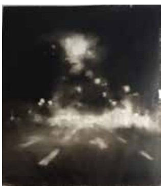
Sonnenstraße 115 x 100 cm, Öl auf Leinwand, 2017

Scherben ein Szenario bildend, das am Boden ansässig ist, dort, wo eben noch getanzt wurde oder geküsst. Auch wenn Süssmayrs Erzählung großstädtischen Treibens in München angesiedelt ist, weist sie doch „über den Ort der Entstehung hinaus“ 4 , hat allgemeine Gültigkeit: Ekstase ist kein Privileg der Bewohner der bayerischen Hochebene. Überall und nirgends könnte der Tanz stattfinden, den Süssmayr festhält in Öl auf Leinwand, allerorten das Fußballspiel, welches die Fans in Ekstase versetzt – selbst das Konzert ist nicht verortbar, Band und Publikum scheinen nicht einer spezifischen Lokalität zuzugehören, sondern vielmehr einer Zeit oder der Geisteshaltung, die diese symbolisiert: Nicht nur in ihrem Erscheinungsbild wirken viele der Protagonisten Florian Süssmayrs den 1970/80er Jahren entsprungen, auch die Referenzen des Malers auf Plattencover und Bands dieser Zeit verbildlichen das, was ihn prägte und bis heute prägt.