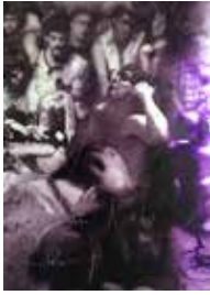
Black Flag in Sweden 200 x 150 cm, Öl auf Leinwand, 2018