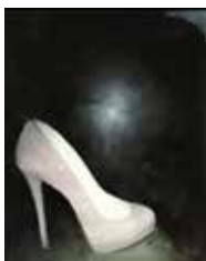
Schuh 30 x 25 cm, Öl auf Leinwand, 2015