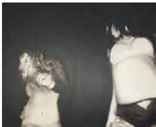
Disko 130 x 160 cm, Öl auf Leinwand, 2014