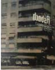
Asbach 170 x 130 cm, Öl auf Leinwand, 2015