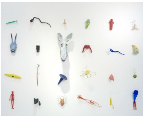
Song, 2011 170 x 250 cm, painted wood