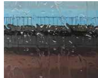
Nizza 80x100 cm, Öl auf Leinwand 2015/2021 4760 EUR