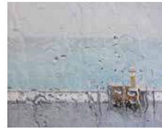
Niça 80x100 cm, Öl auf Leinwand 2014 4760 EUR