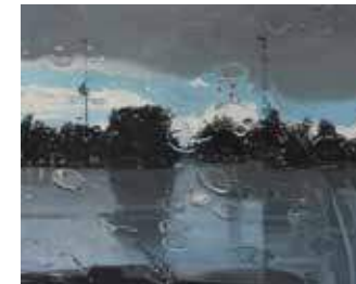
Licht 60x80 cm, Öl auf Leinwand 2016 4200 EUR