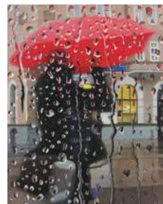
Roter Regenschirm 50x40 cm, Öl auf Leinwand, 2021 3000 EUR