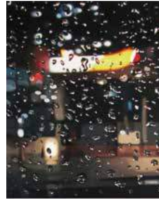
Tankstelle 50x40 cm, Öl auf Leinwand 2021 3000 EUR