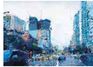
Stadt 100x140 cm, Öl auf Leinwand 2018 7140 EUR