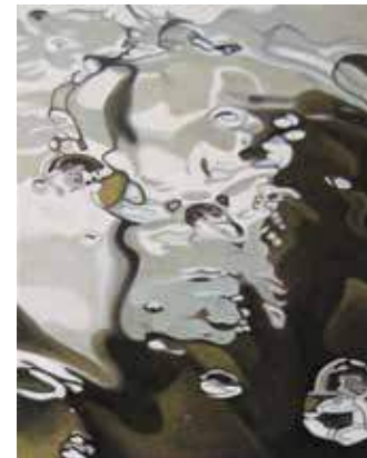
Tropfen Gold 40x30 cm, Öl auf Leinwand 2021 2000 EUR