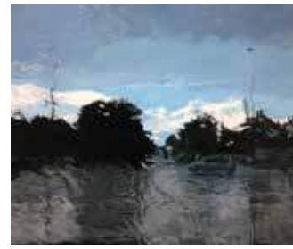
Im Auto 90x110 cm, Öl auf Leinwand 2014 5950 EUR