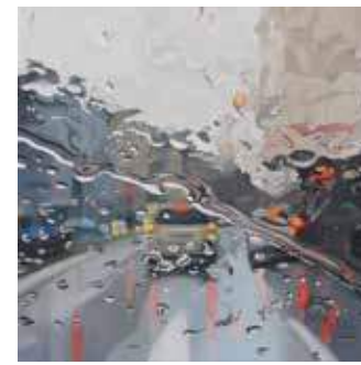
Schwabing 50x50 cm, Öl auf Leinwand 2021 3300 EUR