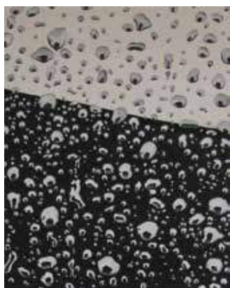
Schwarzer Regenschirm 50x40 cm, Öl auf Leinwand 2021 2670 EUR