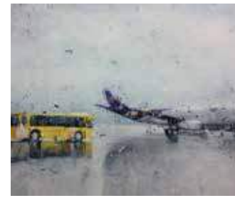
Healing 100x120 cm, Öl auf Leinwand 2014 6545 EUR

Geschäftsführerin Kunstkonnex Artconsulting sl@kunstkonnex.com