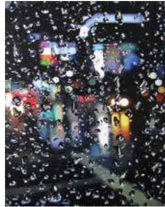
In der Nacht 80x60 cm, Öl auf Leinwand 2020 4200 EUR