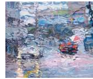
Busan II 54x60 cm Öl auf Leinwand 2018 3800 EUR