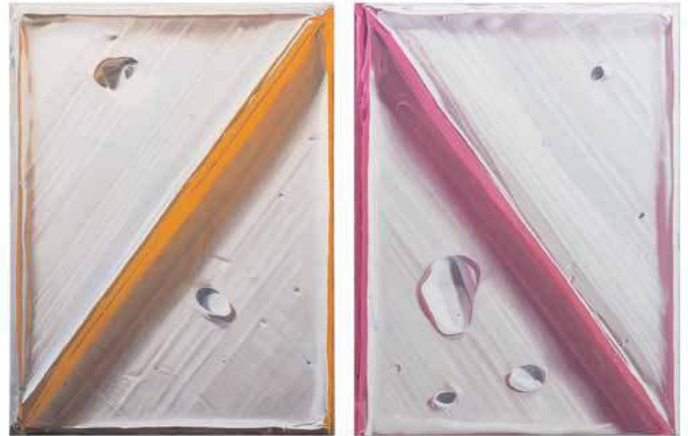
Zweiteilig, bestehend aus: weiß, orange vr weiß, pink vl Gesamtpreis 120 × 90 cm Öl/Leinwand 2021, 13.800 EUR