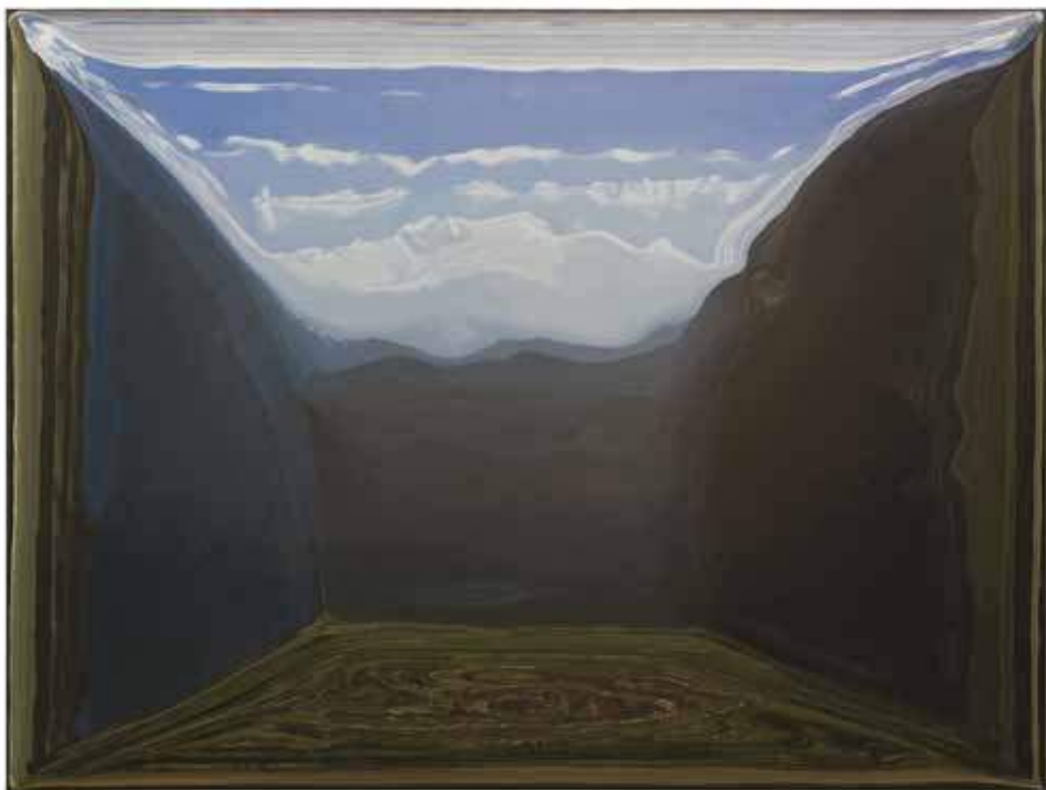
12 Rotwand1 150 × 200 cm Öl/Leinwand 2017, 11.600 EUR