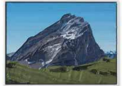
Ohne Titel 15 × 20 cm, Öl/MDF, Schattenfugenrahmen 2021, je 980 EUR