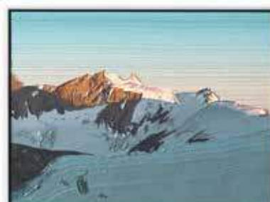
Ohne Titel 15 × 20 cm, Öl/MDF, Schattenfugenrahmen 2021, je 980 EUR