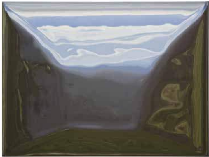
14 Rotwand 60 × 80 cm Öl/Leinwand 2018, 4.600 EUR