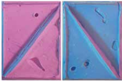
Diptych pink-blue each: No titel (pink / blue and blue / pink) Oil / canvas 64 x 48 cm 2020

The brushwork reflects indentations as well as convex bulges of paint and shadows as well as illuminations on the flat canvas, indicating what the model displayed: the actual three-dimensionality of an abstract mountain.