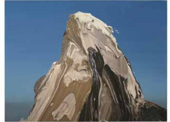
Matterhorn Oil / canvas 150 x 200 cm 2006

tain on top of this in a gesture of pastose application of paint, spontaneously and sketchy, creating a haptic effect with three-dimensionality and sculptural features. The artist thereafter staged this colour relief photographically: natural and artificial incidence of light reflect on the oil sketch in variations of itself, which the artist captured in photographs. He decided on one of the versions that transformed the three-dimensionality of the model into the two-dimensionality of photography. In the final step, he then transferred this photograph into oil on canvas, translating it into a large format, as it were, in an elaborate, painterly, detailed 150 x 200 cm manner, and thus visualized the image in the medium in which it had originated: in painting. The mountaintop of the ZWEITES MATTERHORN (2008) now appears detached in front of a celestial setting, reproducing the rock massif in the same plane structure as the background, completing the trompe l’œil in a flat finish.