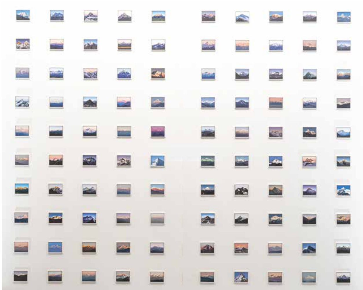
100 Berge (aus der Serie 1000 Berge) jeweils Ohne Titel, Öl / MDF 4,5 x 6 cm, gerahmt 2017 / 18