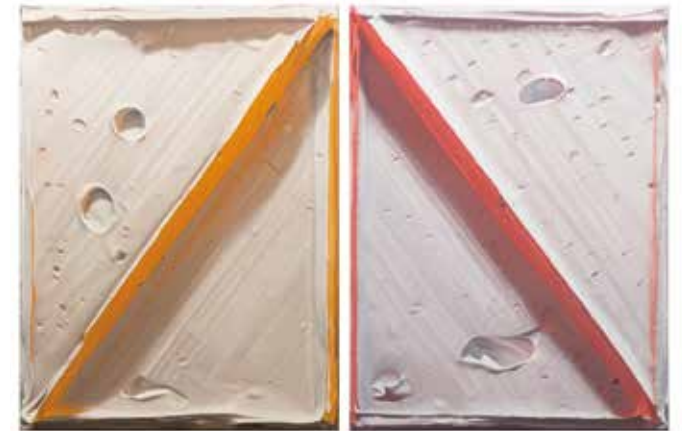
Doppelbild weiß / orange-rot jeweils: Ohne Titel (weiß, orange v.r. und weiß, rot v.l.) Öl / Leinwand 120 x 90 cm

aus: In dem Moment, wo der Künstler die Modelle mit Licht bescheint, spiegelt sich jeweils die Farbe des einen Klötzchens in dem anderen wider. Diesen Dialog zweier Farben hält Felix Rehfeld wiederum fotografisch fest und überführt ihn dann in Malerei. Das Blau des Diptychons scheint nun das Pink widerzuspiegeln, das Orange das Rot, und vice versa, das Spektrum monochromen Farbauftrags erst in der Wechselwirkung gänzlich entfaltend. Der Pinselduktus registriert Tränkendes wie Tropfendes, auf der flachen Leinwand vorgebend, was das Modell besaß: die tatsächliche Dreidimensionalität eines abstrakten Berges.