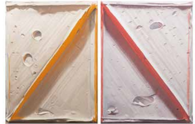
Diptych white / orange-red each: No titel (white, orange and white, red) Oil / canvas 120 x 90 cm

giving an extract." In addition to the experience of 5-star luxury, being able to offer this artistic extract with the Gateway to the Alps of Felix Rehfeld makes Mandarin Oriental, Munich unique.